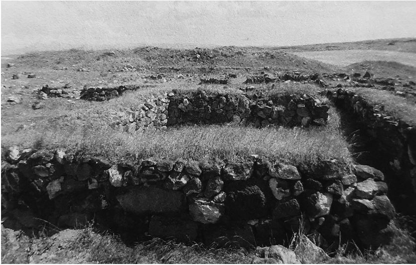
Figura 7. Vendbanimet Orontide. Shekulli i 5 te