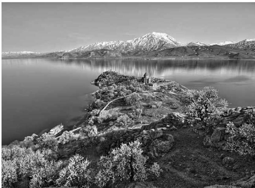
Foto e Malit Artos dhe Liqenit Van në Krahinën e Hajoc Corit (Hayots Dzor), ku Hajku vrau Bel Nimrodin.

fushë të hapur. Edhe nëse Hajku nuk dorëzohej, ai mund të vriste publikisht nipin e Hajkut, gjë që do të ndikonte në marrëdhënien e Hajkut dhe burrave të tij dhe do të thyente besnikërinë e tyre. Ndaj, Nimrodi krijoi këtë plan për t'u hakmarrë ndaj armikut të tij për vrasjen e Manitonit dhe gjashtëdhjetë Titanëve të tij.