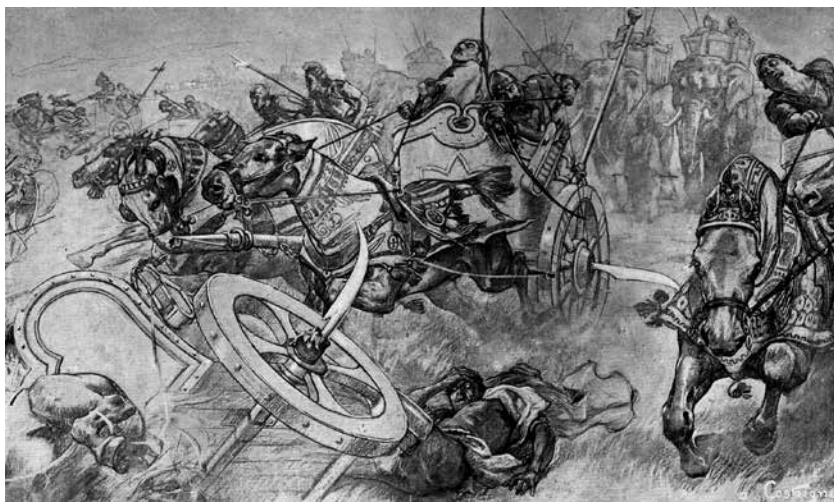
Pamje e Betejës. Pikturuar prej Andre Castaigne gjatë viteve 1898-1899

Nimrodit, dhe Këshilltarët Mbretërorë të të dy mbretërive, vendosën që secili prej tyre të ndiqte planin e përbashkët për pushtimin e secilit prej kombeve Xhafetike. Ushtritë e Nimrodit u nisën për luftë me objekt tokat, të cilat i përkisnin pasardhësve të Xhafetit. Pa e çuar fare ndërmend që kundërshtari i tij mund të shpëtonte dhe mund të hakmerrej, Bel Nimrodi u tregua i pamëshirshëm me vendet që pushtoi, pasi kjo ishte ideja e tij për të ndaluar profecinë e Manitonit.