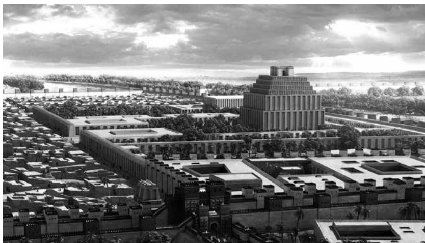
Pamje e Babilonisë

Torgomi i siguroi Hajkut një takim me Nimrodin, djalin e Kushit, me Joktanin, djalin e Eberit, dhe me Feneçin, djalin e Dodanimit, me qëllim që të tre drejtuesit e ndërtimit të Kullës së madhe të Babelit të mund të njiheshin me të. Torgomi i kërkoi Nimrodit, që të mund të siguronte mjetet e nevojshme të jetesës për djalin e tij, pasi Nimrodi ishte Mbret i Babilonisë. Nimrodi u ndje i nderuar, që Torgomi i kërkoi atij të siguronte mjetet e nevojshme të jetesës për Hajkun, në vend që t'ja kërkonte këtë favor Feneçit, një pasardhësi të Xhafetit. Feneçi ishte në krye të pasardhësve të Xhafetit në Babilon. Torgomi dhe Hajku, gjithashtu, ishin pasardhës të Xhafetit, dhe Torgomi kishte shumë respekt për Feneçin; sidoqoftë, Torgomi, duke e ditur që Nimrodi ishte mbret i Babilonit, e trajtoi çështjen e Hajkut me Nimrodin, duke pasur ndër mend të ardhmen e Hajkut në mbretërinë e Nimrodit. Bel Nimrodi e vendosi Hajkun në kampin e Titanëve, i cili ishte nën kujdesin e tij. Nimrodi i premtoi Torgomit se Hajku do të ishte nën kujdesin e tij, pas së cilës Torgomi, i cili tashmë i kishte shitur kuajt, e pagoi Nimrodin për strehimin dhe ushqimin