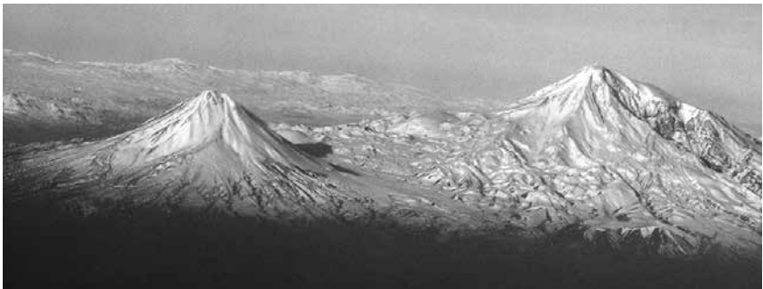
Malet Ararat simbolizojnë rrënjët e popullit Armen.