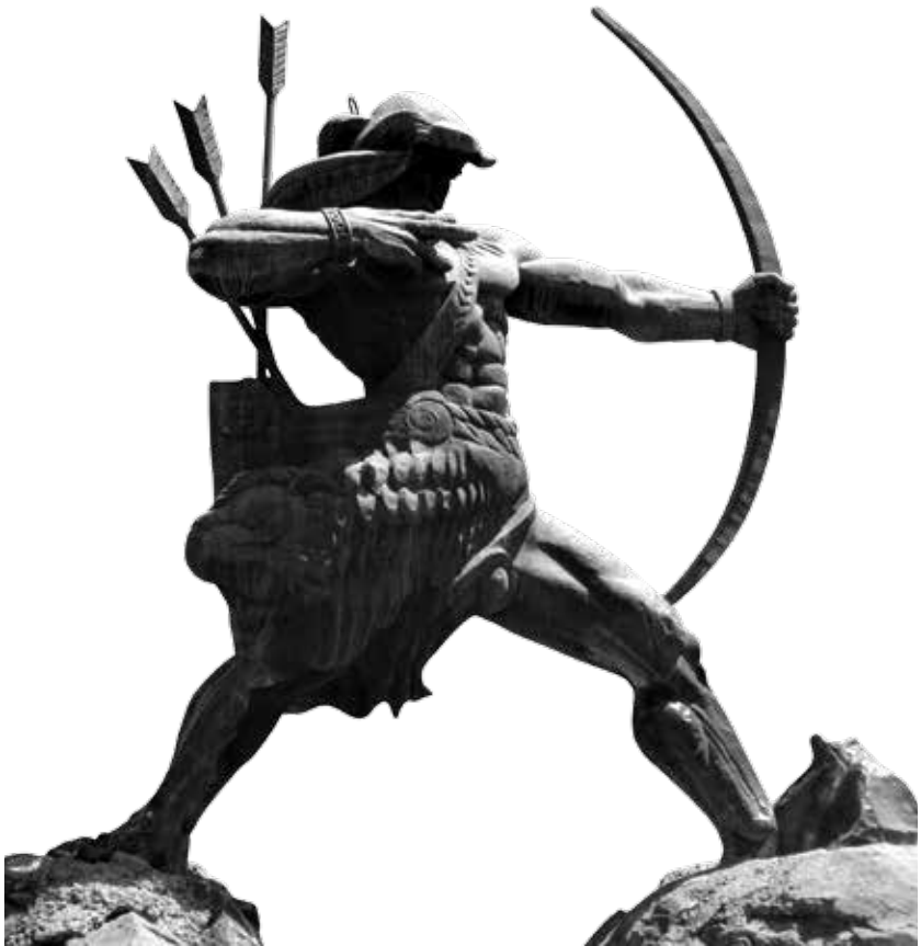
Statuja e Hajkut si Harkëtar i Madh është punuar si skulpturë nga Karlen Nurinjanian në vitin 1975. Ajo është vendosur në kryeqytetin e Armenisë, në Erevan.