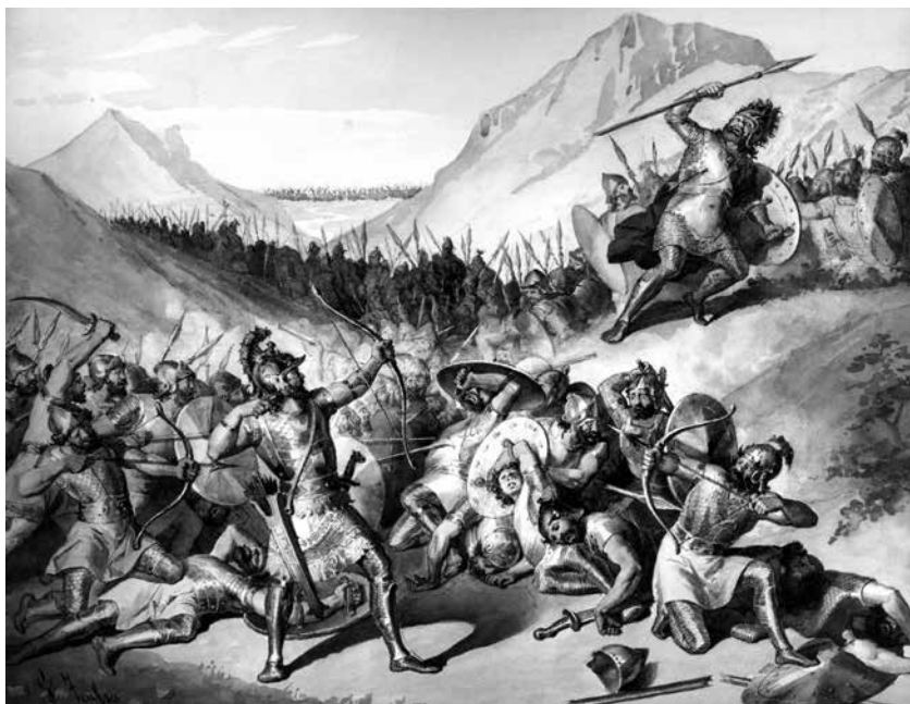
Lufta e Hajkut dhe Belit (Pikturë e Juliano Zasso)

mbretërisë së tij në Babiloni dhe rreth faktit që Hajku mund të ishte ai prej pasardhësve të Xhafetit, i cili ishte parashikuar nga profecia e Manitonit për të shkatërruar Nimrodin dhe Babiloninë.